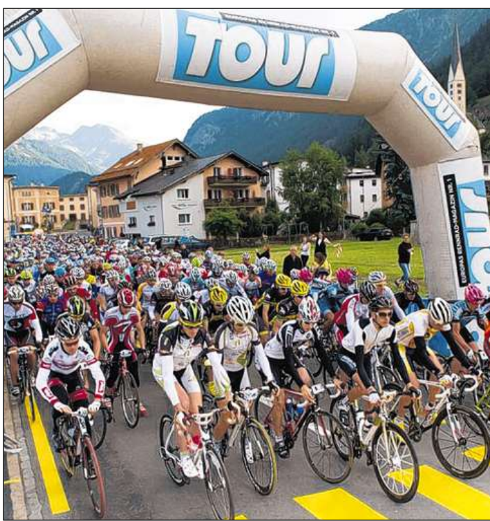
Zernez as vuol profilar eir sco paradis per velociclistas e velociclists.