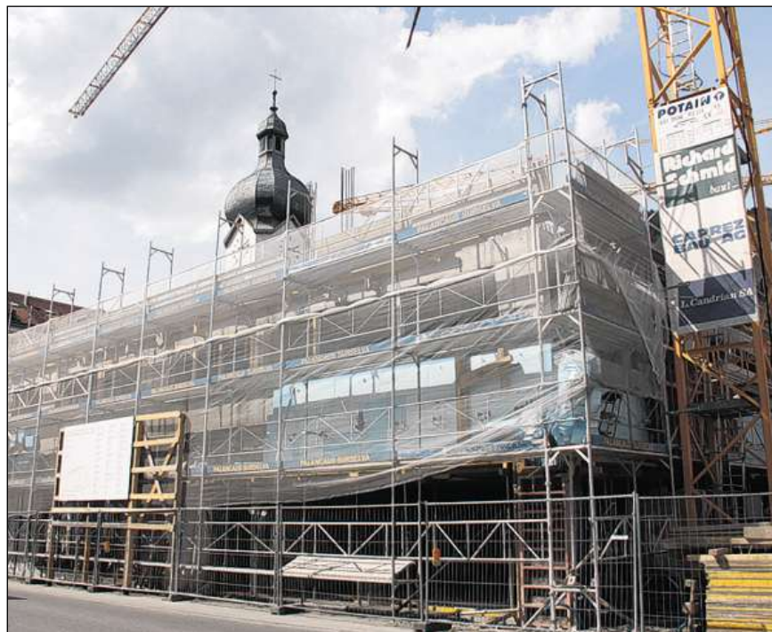
Il baghetg niev dalla Banca Raiffeisen Surselva ei aunc in plaz da baghetg. Quest atun vul la banca installar la sedia principala en quei baghetg. Artists indigens embelleschen las stanzas da sesida e da cussegliaziun.