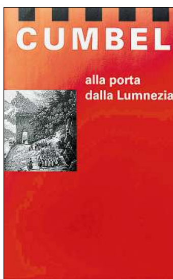
Fronstispezi dalla nova publicaziun «Cumbel – alla porta dalla Lumnezia».