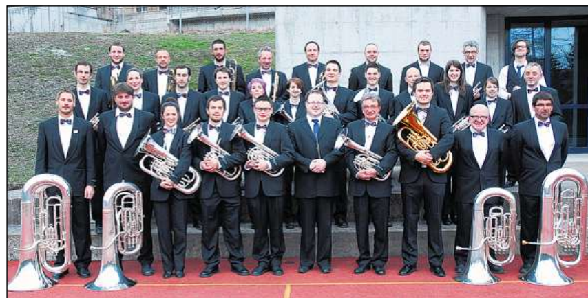
L'Uniun da musica Sagogn a caschun dil concert preparativ a Valendau avon in'jamna.