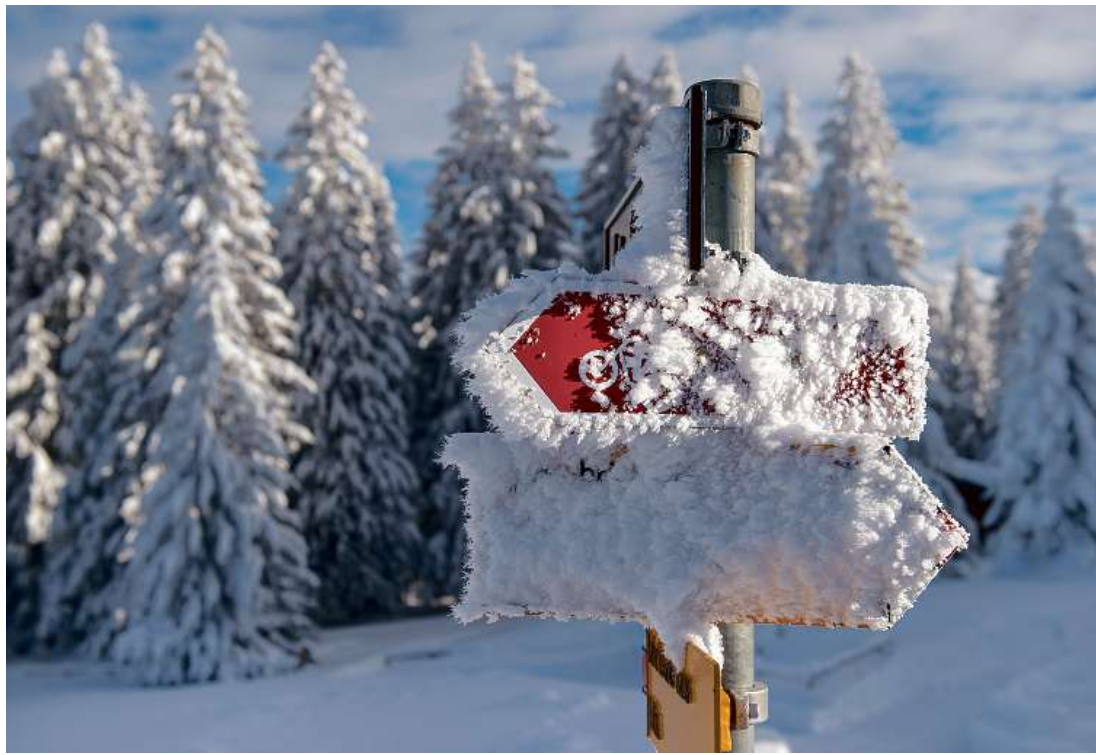
Für das Naherholungsgebiet Brambrüesch werden die Wegweiser in die Zukunft gestellt.